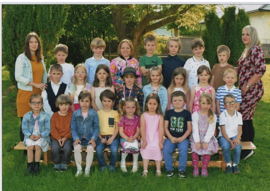
Mateřská škola Pastelka, Malešov 2023 - 2024