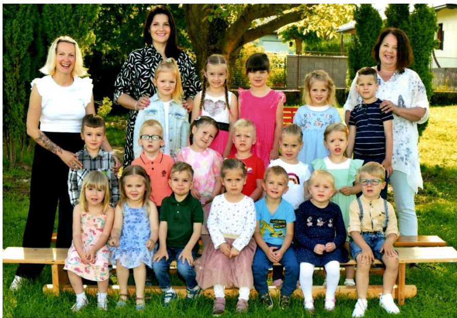
Mateřská škola Pastelka, Malešov 2023 - 2024